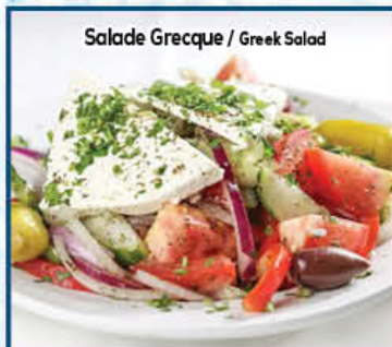
Salade Grecque / Greek Salad