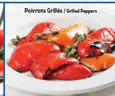
Poivrons Grillés / Grilled Peppers