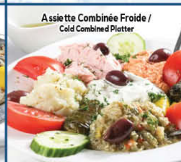
Assiette Combinée Froide / Cold Combined Platter