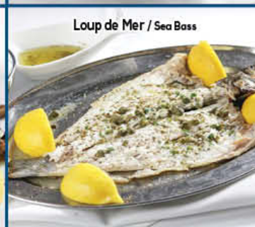
Loup de Mer / Sea Bass