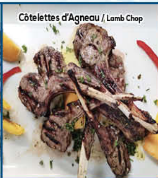
Côtelettes d'Agneau / Lamb Chop