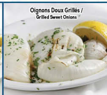
Oignons Doux Grillés / Grilled Sweet Onions