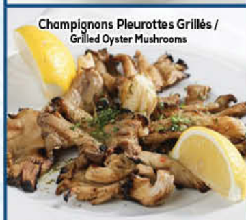
Champignons Pleurottes Grillés / Grilled Oyster Mushrooms