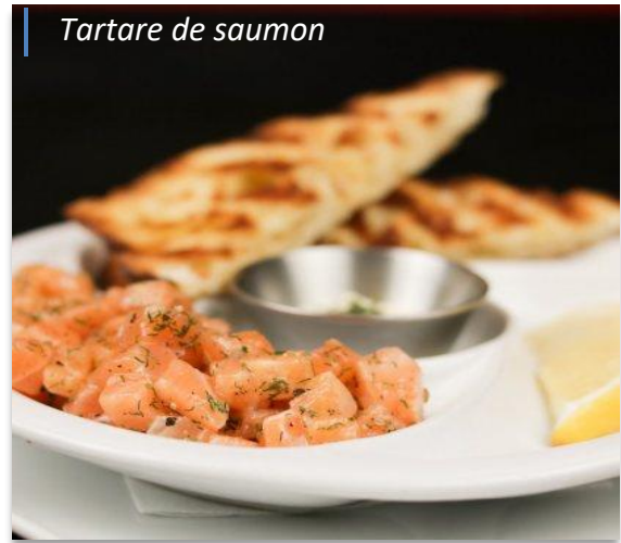
Tartare de saumon

Servie avec sauce tartare maison, quartier de citron & pain grillé Served with tartar sauce, slice of lemon and toasted bread